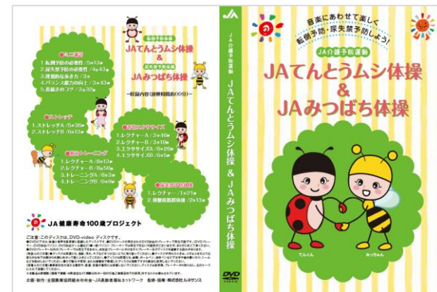
【DVDジャケットイメージ】

DVDに収録されているメニューは、地域の仲間と集まって、 またご自宅でお一人でも、ムリなく、カンタンに楽しく実践できる構成です！